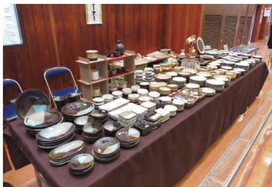
復興支援の小石原焼のブース

芸品店、楽器店、婦人服販売、時計店、化粧品店など様々な小売業が加入されています。会場では各店舗ごとにイベントや実演などが行われていました。