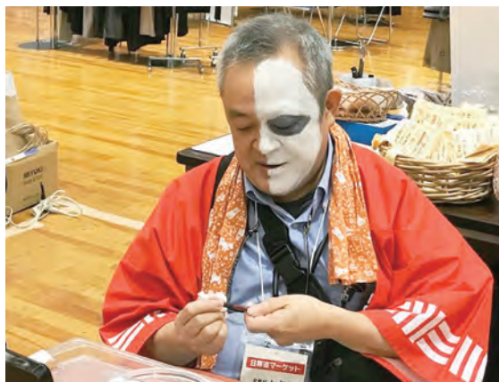
化粧品店の社長による舞台化粧の実演

芸品店、楽器店、婦人服販売、時計店、化粧品店など様々な小売業が加入されています。会場では各店舗ごとにイベントや実演などが行われていました。