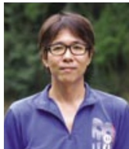
心理カウンセラーの資格を保育に活かしている野間園長