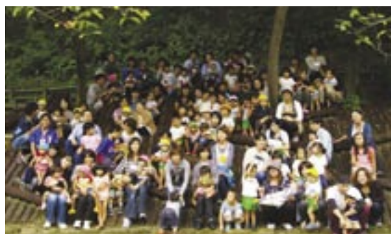
みんなで集合写真