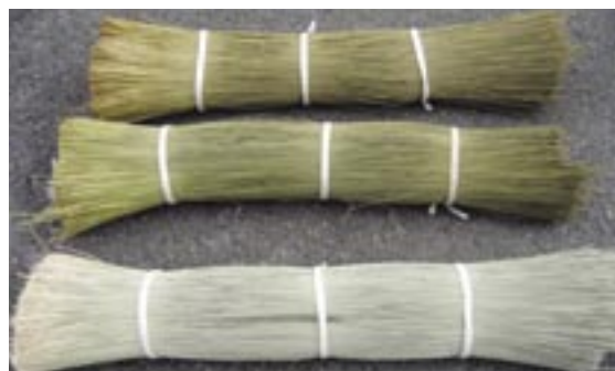
手前がい草生元草 後方が茶染加工したもの

「今回お茶で染めたものは深いグリーンです。消費者の誰が見ても国産と分かるものを作りたいかった」