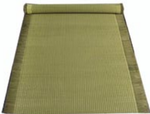
今回開発した「茶染畳表」 従来品よりも深い緑色をしています