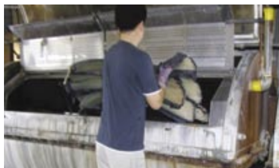
茶染め加工をしているところ