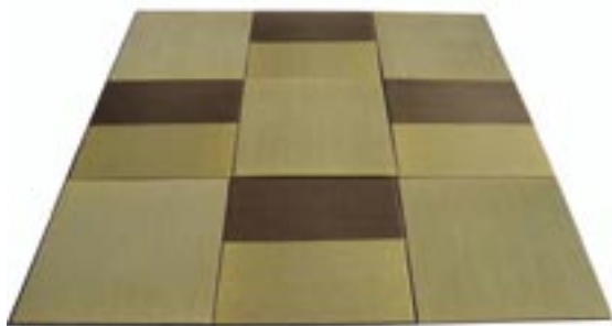
ユニットラグなどの加工品にすることもできます