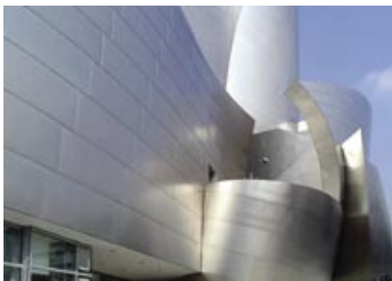
ロサンゼルス・ディズニー・コンサートホール

「中小企業において、一番の競争力の源泉は機 械設備の良し悪しではなく、人材と考えていま