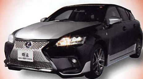
博多織をはじめとした伝統工芸と最先端の自動車の融合 九州オリジナルカスタマイズカー「輝匠」