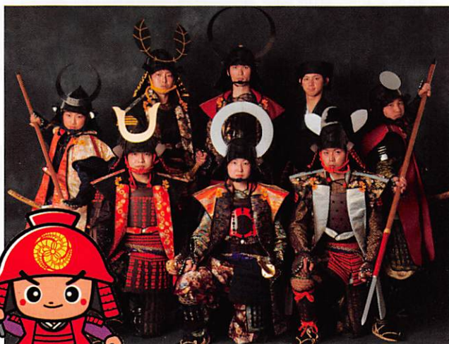
ふくおか官兵衛くん