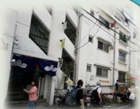
〈リノベーションミュージアム冷泉荘〉

福岡市中央区の旅館育ち。九州大学理学部卒業後、旭化成で臨床研究を17年行い、大家業の吉原住宅に後継者入社。老朽化経営危機の博多区山王マンションにおける、2003年福岡初のリノベーションが経営再生とひとつのつながりを生み出すことを確認し「ビンテージ賃貸」の概念を確立。続き、築57年「冷泉荘」でH24福岡市都市景観賞。その後、福岡を中心に28棟を再生。久留米市での経年団地再生事業、大牟田市の商店街活性化でも活動中。