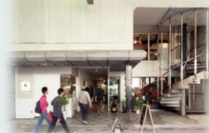
〈メルカート三番街〉