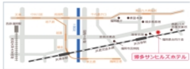
※公共の交通機関をご利用下さい。